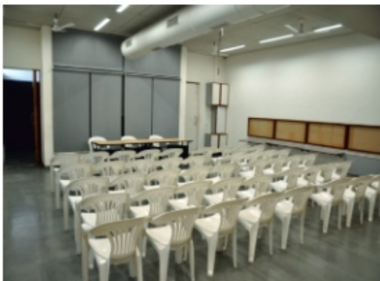
Shri K.D. Patel Training Center (50 seats)