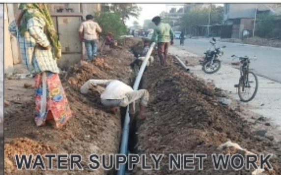
WATER SUPPLY NET WORK