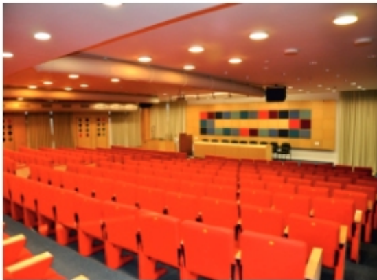
Shri Babukaka Auditorium (250 seats)