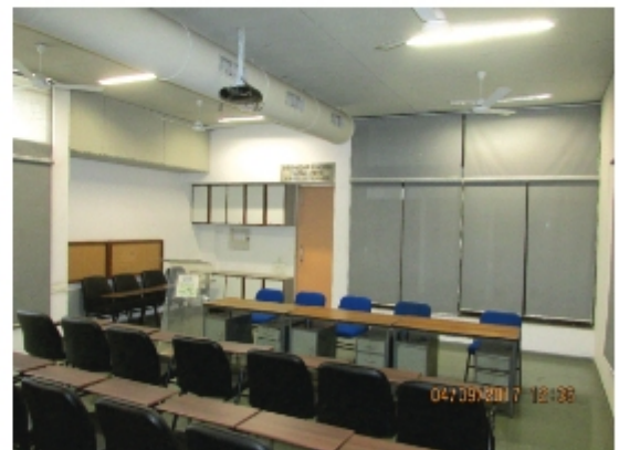
Shri Bansidhar Foundation Training Center (50 seats)