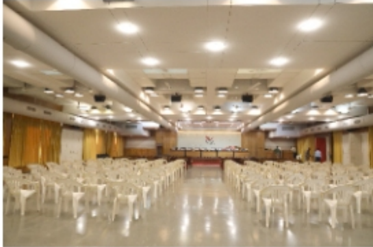
Torrent Seminar Hall (500 seats)