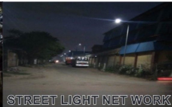
STREET LIGHT NET WORK